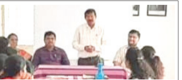
సైకాలజీ ల్యాబ్ లో చైల్డ్ సైకాలజీ ప్రారంభమైన తరగతులు