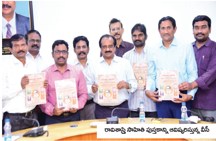
రావిశాస్త్రి సాహితీ పుస్తకాన్ని ఆవిష్కరిస్తున్న వీసీ